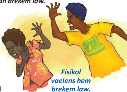
Fisikol vaelens hem brekem law.

Fisikol vaelens hem taem nara man hem hitim, pansim, slapem, presim nek blo waef, pikinini o olketa nara pipol insaed famili. Bonem o iusim eniting osem naef o stik fo kilim olketa lo famili hem fisikol vaelens tu ia.