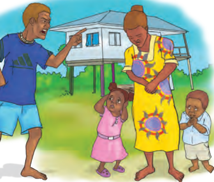
Imosonol vaelens hem brekem law.

Taem hasban tok spoelem waef an mekem hem fil nogud, hem imosonol vaelens. Hem imosonol vaelens tu taem man hem no letem waef blo hem fo go lukim famili an olketa frens blo hem.